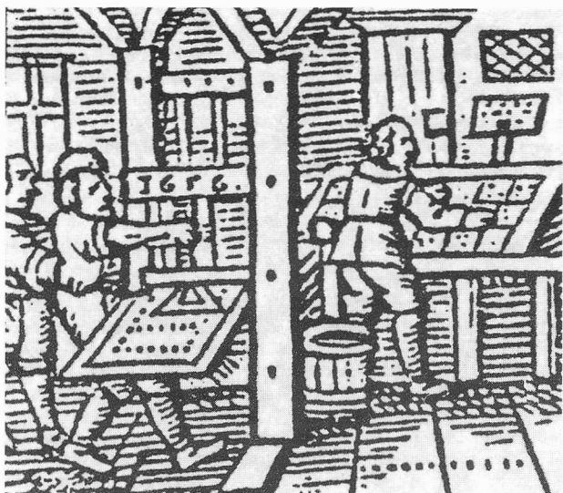
Een 17de eeuwse drukkerij, onderdeel van een vignette van de Dordtse drukker Nicolaas de Vries. Afgebeeld in STAMKOT.