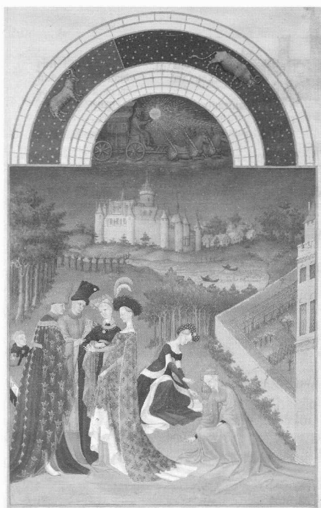
De maand april, afgebeeld in 'Les Tres Riches Heures' van de hertog van Berry (Musée Condé, Chantilly) te zien in NIMEGEN.

De SCHEPPER, Marcus, ABC – Antwerpse Bibliothele Collecties. Catalogus bij de tentoonstelling in de Bibliotheek Stadscampus Universiteit Antwerpen (Uitgave van de Vereniging van Antwerpse Bibliothele, NR 2). Antwerpen, 2005. 80 pp., ill., geb. ISBN 90 80885 2 5. (zie ANTWERPEN).